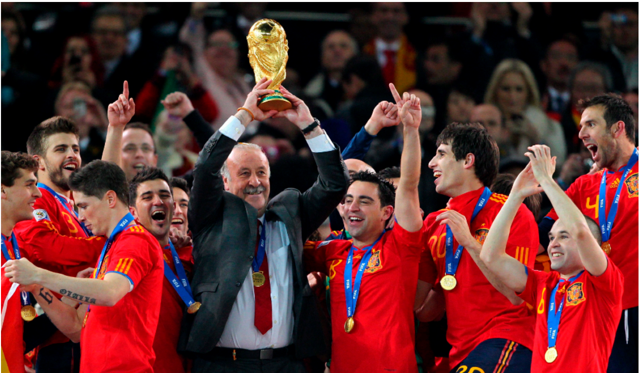
Vicente del Bosque, exseleccionador de la Selección Española, levanta la Copa del Mundo momentos después de ganar la final.

En todas estas facetas se busca la excelencia deportiva, pero esta no debe entenderse solo como la consecución de títulos y trofeos, sino principalmente como la búsqueda de una manera ética y estética de alcanzar los logros de desarrollo personal y social. Se da la importancia a la persona, considerando el Deporte como una parte fundamental de la misma. Se vinculan los éxitos al esfuerzo y al trabajo. Se ampara a los deportistas en su carrera deportiva, pero también en su formación.