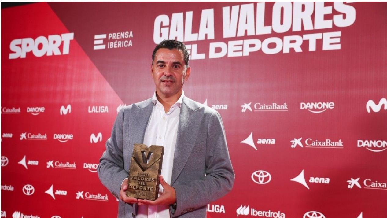
Michel, entrenador del Girona FC, recibiendo el premio valores del deporte 2023

Una de las claves en la formación de jóvenes futbolistas que aborda es relacionar al entrenador con la figura del profesor y que el padre tenga una educación deportiva muy estrecha en relación al entrenador. Igual que está instalada en nuestra sociedad una temprana relación padre-profesor, se debe trabajar el vínculo de padre-entrenador . Lo lógico es siempre instalarse en la crítica, trasladando conceptos negativos en el entorno. Hay una educación deportiva que inculcar no solo a los niños para que les impulse a entrenar y dar el máximo rendimiento en todo momento. Su entorno debe impulsar ese aprendizaje y no impedir que acabe evolucionando.