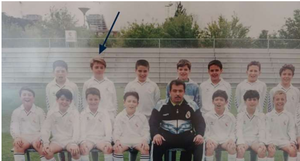
Ciudad Deportiva Real Madrid. Categoría Alevín, temporada 93/94

Sin embargo, una vez entrados en los años 2000, las escuelas comenzaron a crecer de manera abrumadora. Se necesitaban cada vez más entrenadores de fútbol y no todos eran tan vocacionales como los del comienzo. Es decir, que fuimos ganando en formación, pero fuimos perdiendo en vocación por el exceso de demanda que hacía falta cubrir . Esta es una de las bases fundamentales del libro ¡Que Golazo! que tuve la oportunidad de presentar en la feria del libro de 2021.