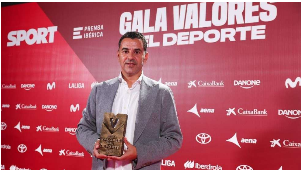
Michel, entrenador del Girona FC, recibiendo el premio valores del deporte 2023

Una de las claves en la formación de jóvenes futbolistas que aborda es relacionar al entrenador con la figura del profesor y que el padre tenga una educación deportiva muy estrecha en relación al entrenador. Igual que está instalada en nuestra sociedad una temprana relación padre-profesor, se debe trabajar el vínculo de padre-entrenador . Lo lógico es siempre instalarse en la crítica, trasladando conceptos negativos en el entorno. Hay una educación deportiva que inculcar no solo a los niños para que les impulse a entrenar y dar el máximo rendimiento en todo momento. Su entorno debe impulsar ese aprendizaje y no impedir que acabe evolucionando.