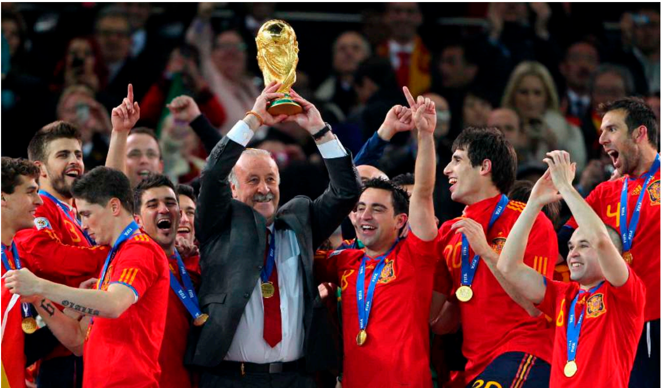
Vicente del Bosque, exseleccionador de la Selección Española, levanta la Copa del Mundo momentos después de ganar la final.

En todas estas facetas se busca la excelencia deportiva, pero esta no debe entenderse solo como la consecución de títulos y trofeos, sino principalmente como la búsqueda de una manera ética y estética de alcanzar los logros de desarrollo personal y social. Se da la importancia a la persona, considerando el Deporte como una parte fundamental de la misma. Se vinculan los éxitos al esfuerzo y al trabajo. Se ampara a los deportistas en su carrera deportiva, pero también en su formación.